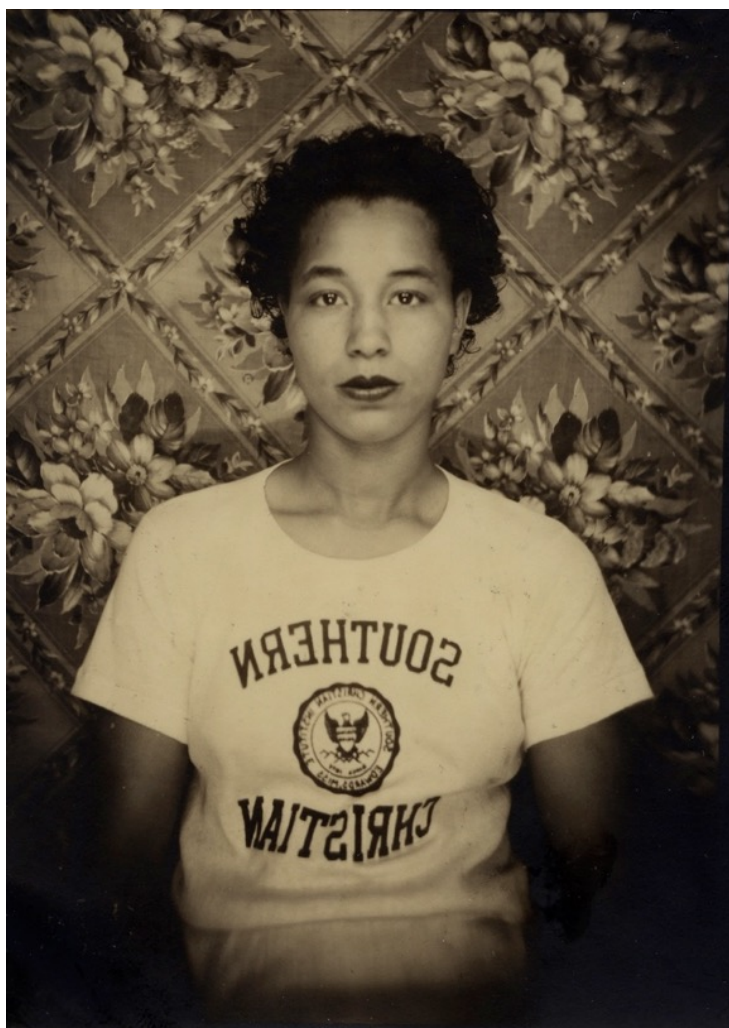
Photographie anonyme © Les Douches la Galerie, Paris

Du mercredi au samedi de 14h à 19h ou sur rendez-vous