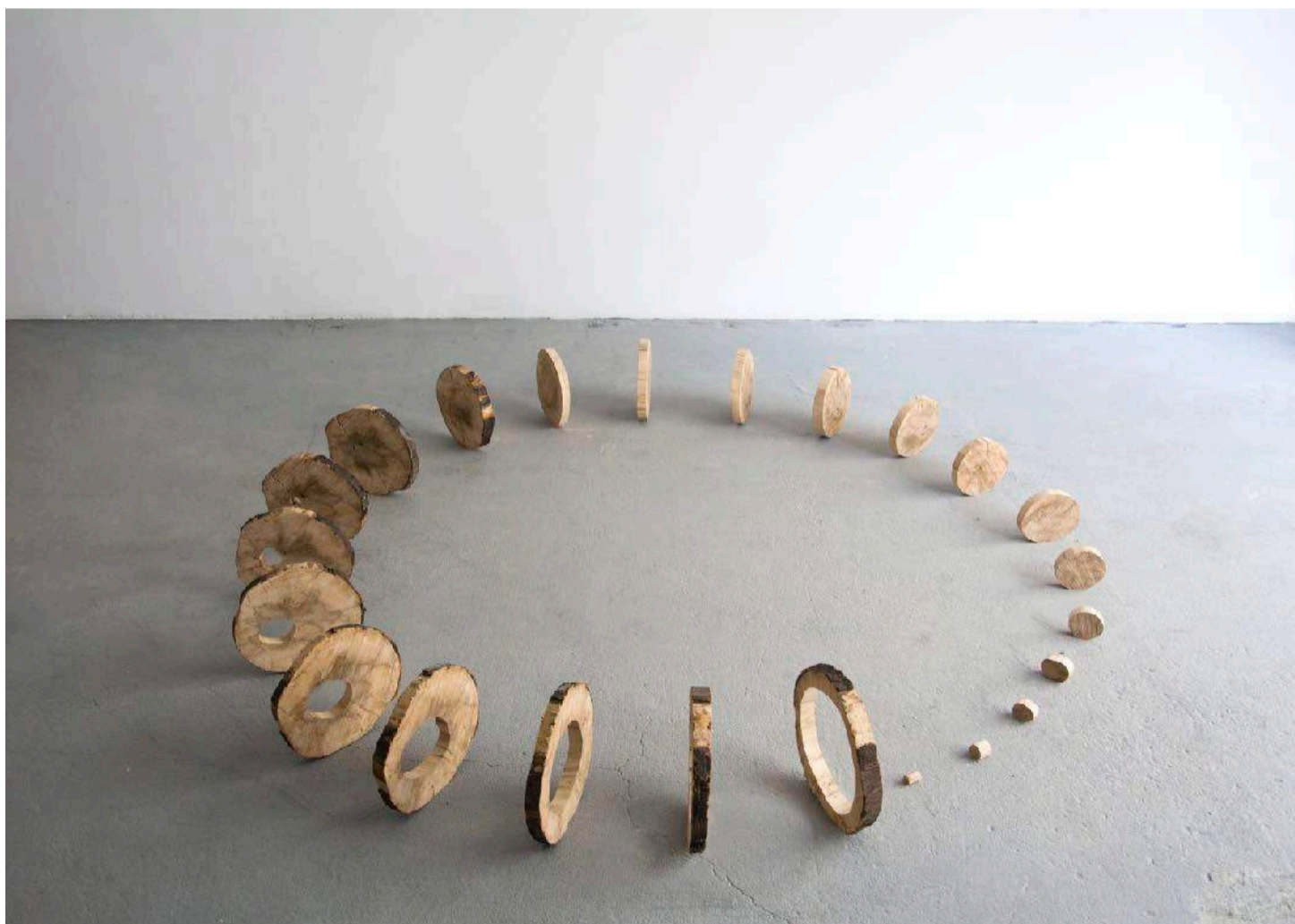
Zéro , 2012 - Tronçon débité, dimensions variables - Pièce unique

Grandir, construire, gravir les montagnes, s'élever vers le ciel et au terme de sa vie, s'affaisser, se casser. La question du corps, de sa verticalité bien singulière, et du désir d'élévation de l'être humain est aussi une notion importante de son travail.