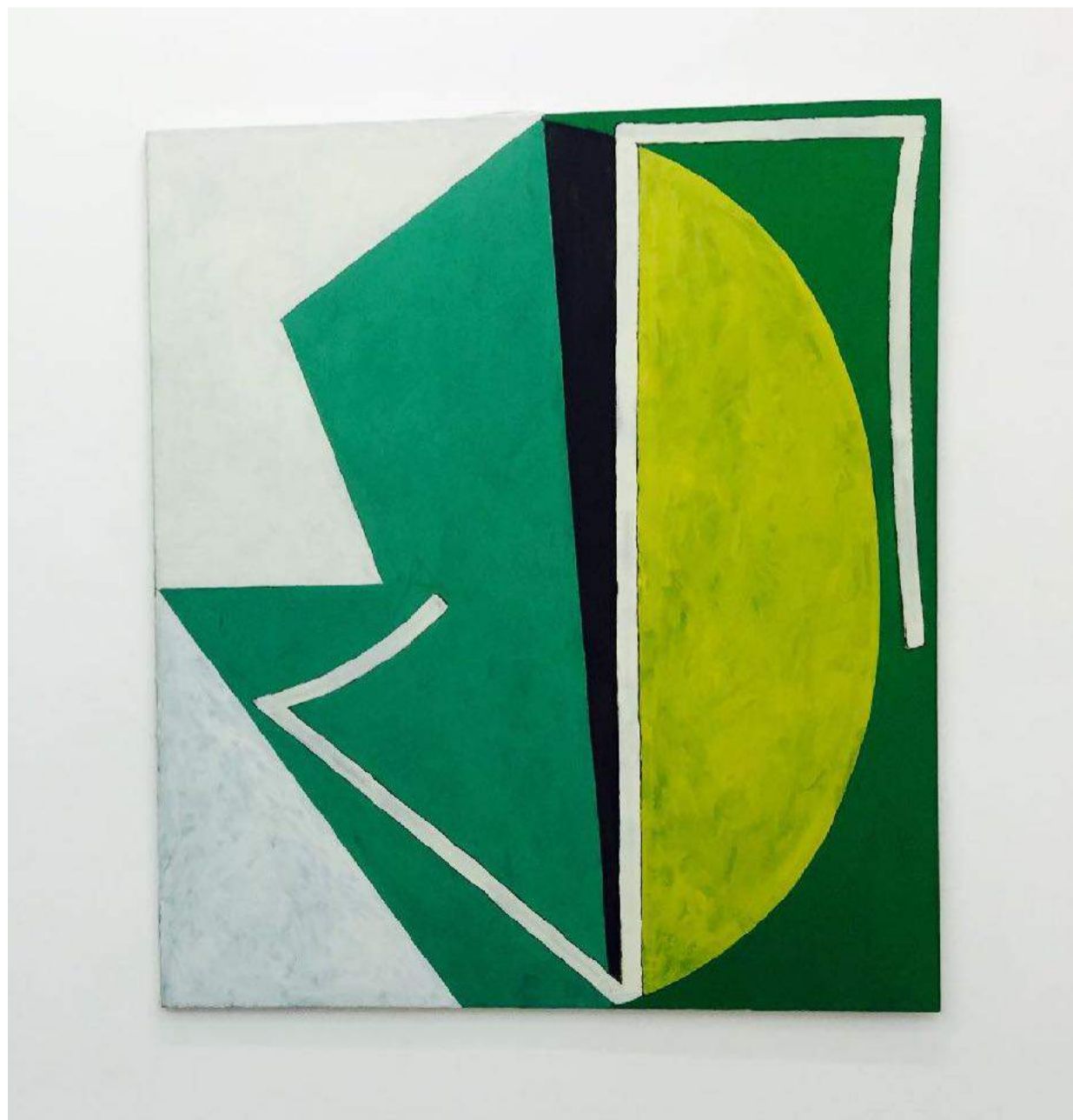
Cycle espagnol , 1986 - Huile sur toile, 140 x 120 cm Courtesy the artist and Laure Roynette Gallery

Son travail est présente dans les collections françaises publiques suivantes: Musée National d'Art Moderne Centre Georges Pompidou , Paris, France, Musée d'Art Moderne de la Ville de Paris , France, Musée des Beaux-Arts, Besançon, France, Fond Régional d'Art Contemporain de Franche-Comté , France, Fond National d'Art Contemporain, France.