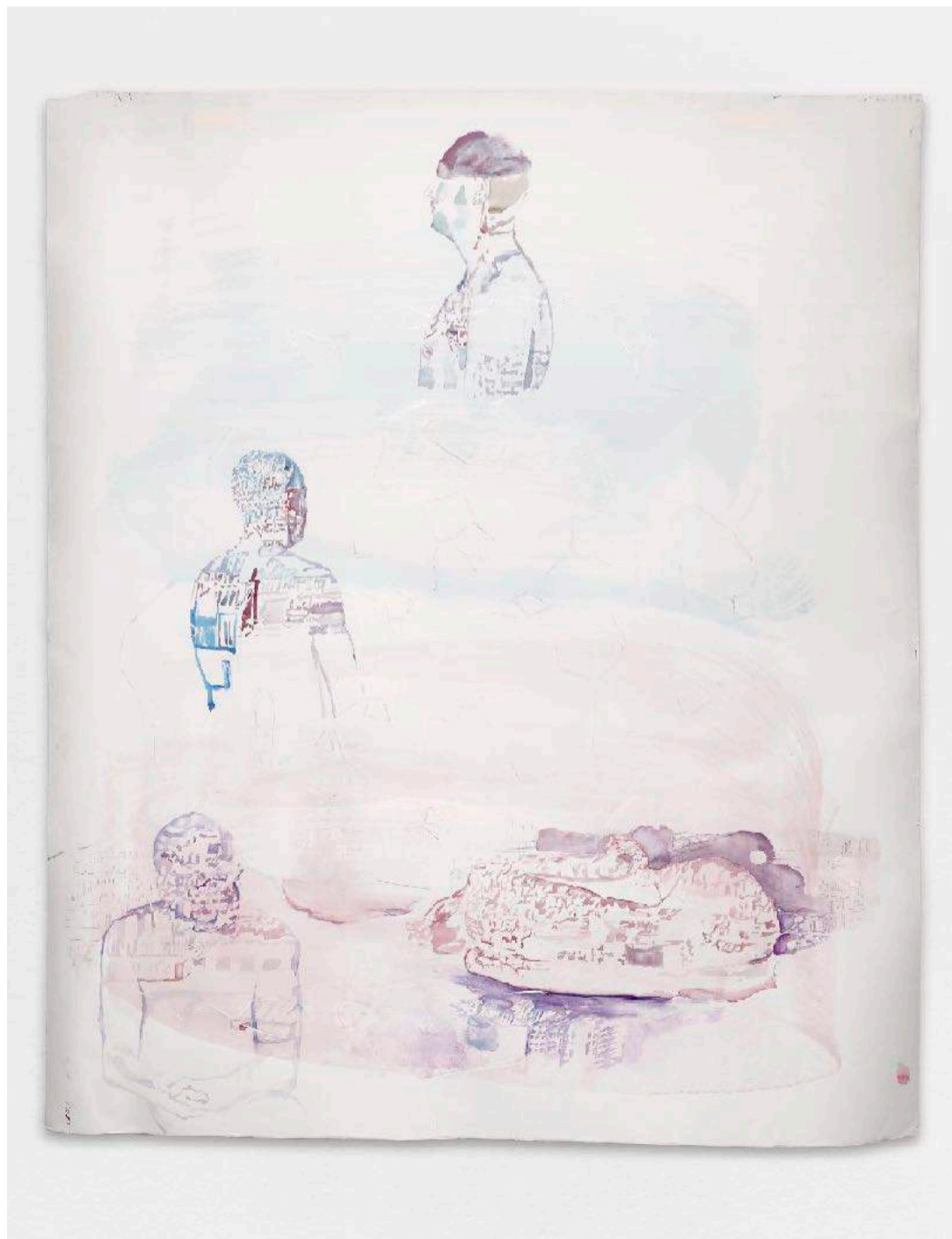
Bystander effect chapitre I , 2017 - Aquarelle et encre sur papier à grain toilé - 147 x 128 cm

Extrait du texte de Giovanna Dalla Chiesa , Historien et critique d'art