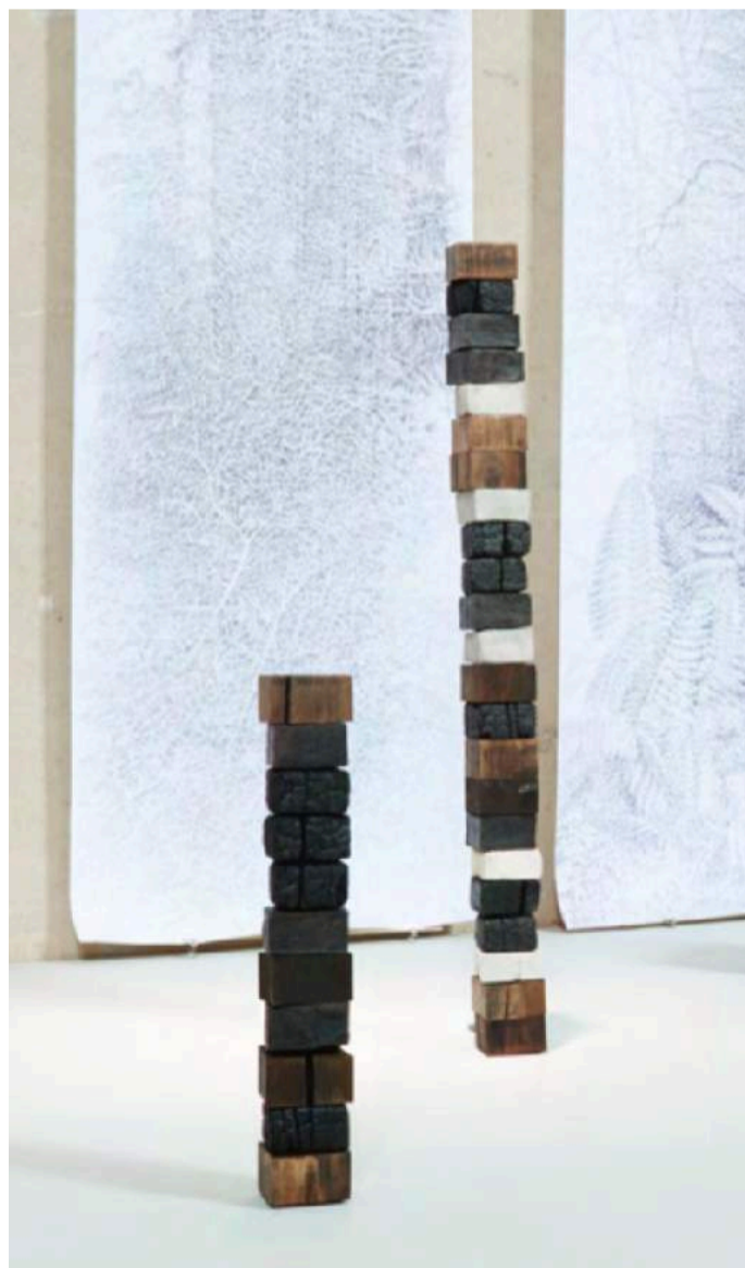
Archives naturelles , 2016, Sculpture en bois de chêne, grès enfumé, charbon ciment, 110 x 12 x 12 cm - Pièce unique