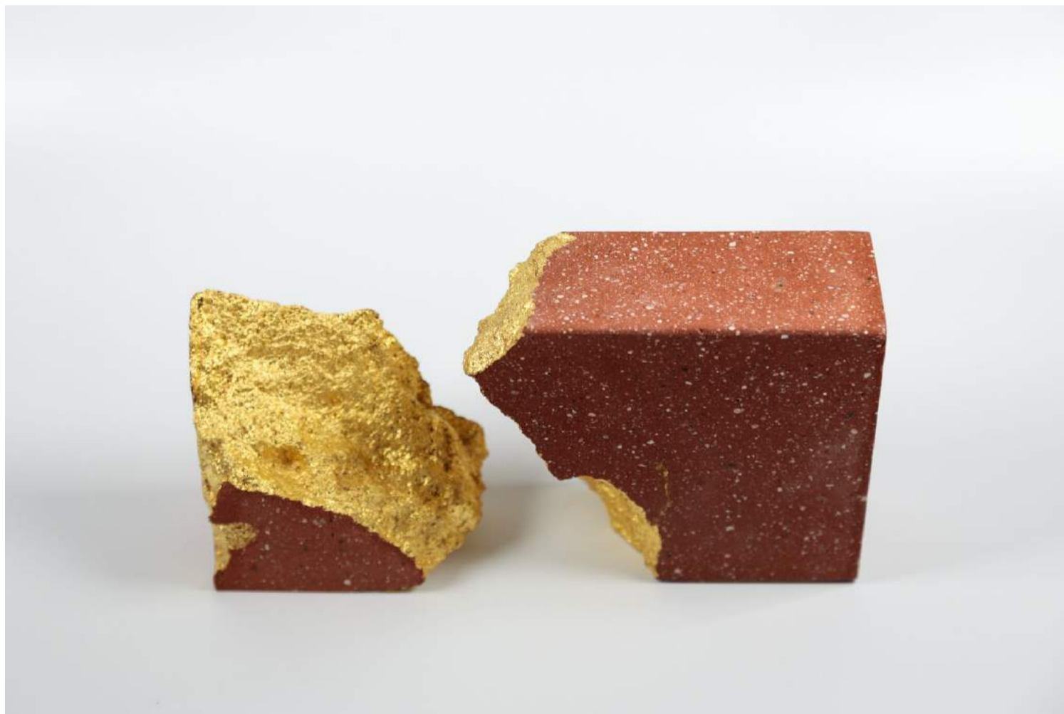
Brique , 2016 - brique et or 22KT 12,5 x 10,5 x 4,5 cm - Pièce unique